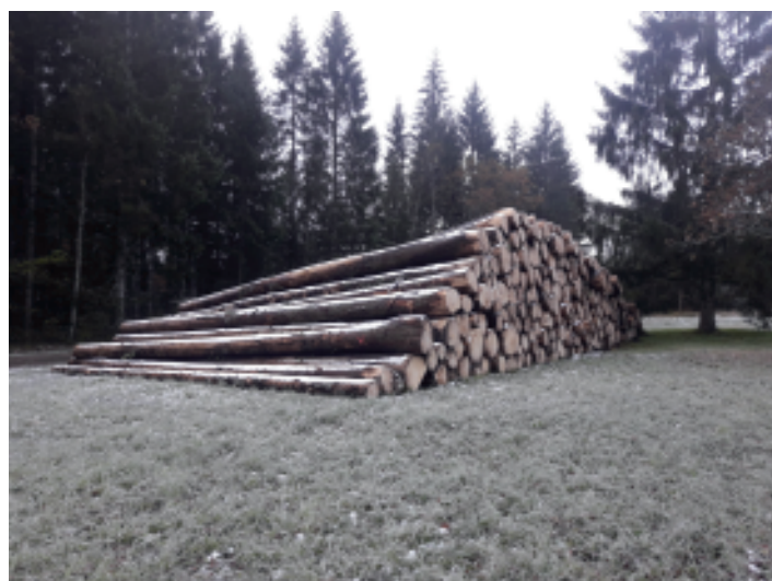
Automne 2019 : grumes d'épicéa scolytés destinées à une exportation vers la Chine.

De leur côté, dès 2020, les Communes forestières de Bourgogne-Franche-Comté engageront des formations sur les modes de vente à destination des maires et des élus en charge de la forêt.