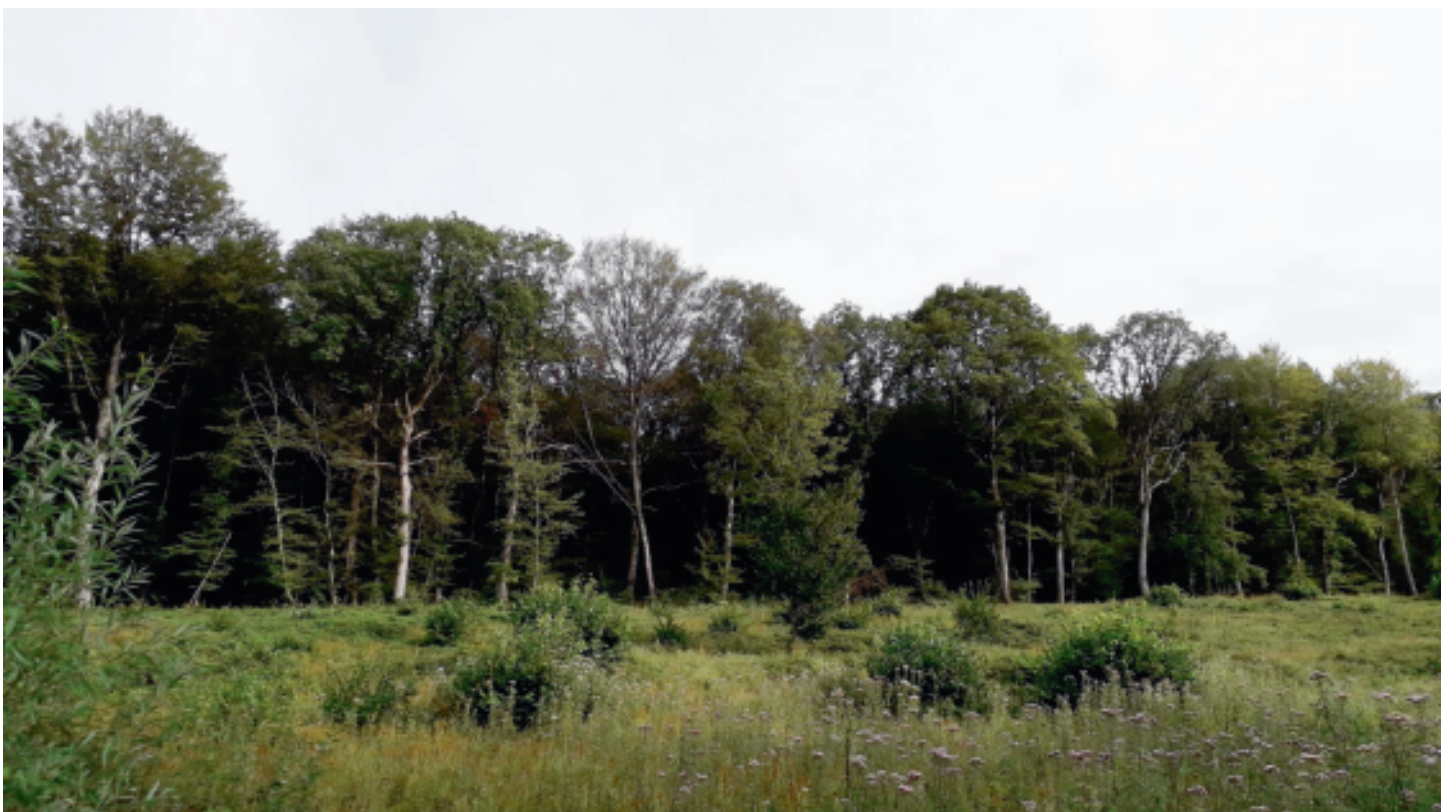
Été 2019 : peuplement de hêtre défolié.

Les Communes forestières en lien étroit avec l'ONF et les autres acteurs de la production forestière se sont fortement mobilisées pour alerter le gouvernement afin qu'il prenne conscience de la gravité de la situation. En réponse, l'État a, d'une part, affecté 16 M€ pour une aide exceptionnelle à l'exploitation et la commercialisation des épicéas scolytés (6 M€) et à la reconstitution des peuplements (10 M€) et, d'autre part, engagé une mission pour écrire une feuille de route sur la forêt et la filière bois dans ce contexte de changement climatique.