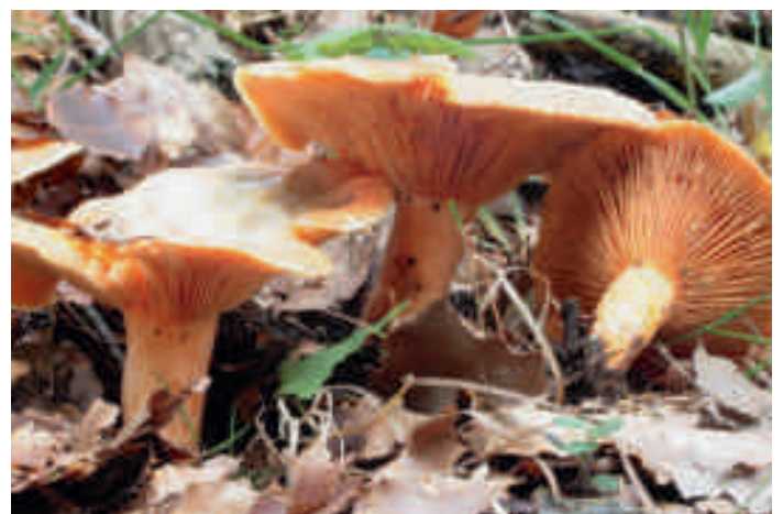
Le cas de la cueillette illicite des lactaires : un exemple d'action visant à prévenir les conflits d'usage

Elle a recueilli l'adhésion de 32 communes et près de 245 personnes (dont 184 habitants des communautés de communes impactées et 235 habitants du Doubs ou du Jura) ont demandé la carte les autorisant à cueillir des lactaires sur le territoire des communes participantes.