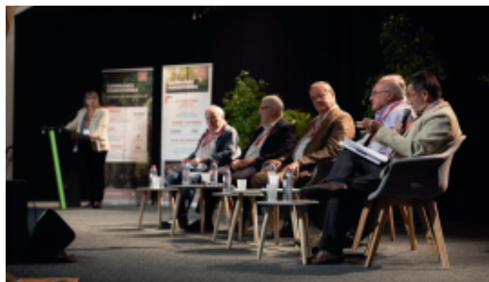
Congrès national des Communes forestières, Epinal, 6 et 7 juin 2019.