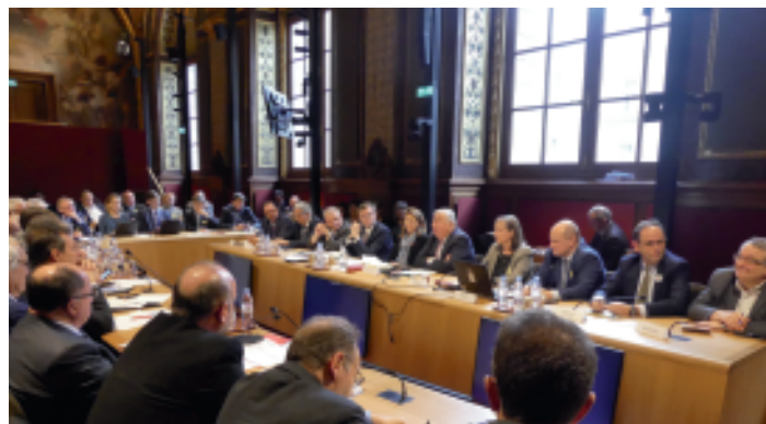
Salon des Maires, 19-21 novembre 2019, Paris.