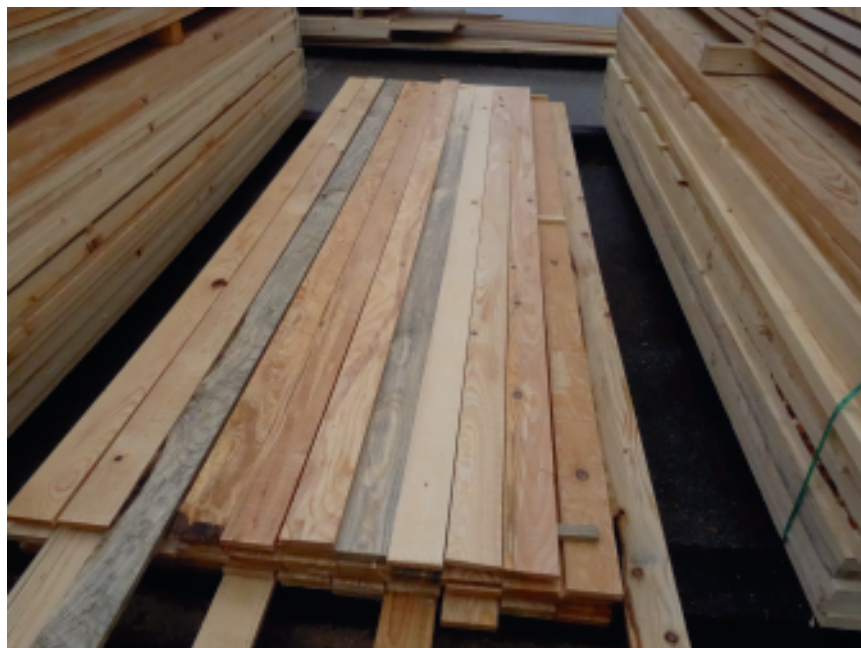
2 planches de bois scolyté utilisables dans la construction.

L'identification d'un lot de bois dans la forêt communale de Maîche a été réalisée par l'ONF. L'utilisation de bois scolytés, ne trouvant pas de débouchés actuellement, a été recherchée.