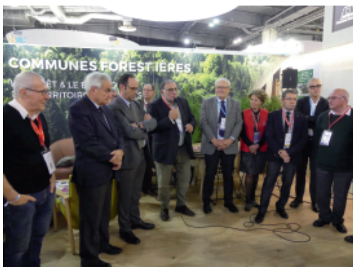
Salon des Maires, 19-21 novembre 2019, Paris.

Dans un contexte de crises sanitaires majeures en forêt engendrant des incertitudes scientifiques et techniques, les Communes forestières se sont engagées avec la filière forêt-bois dans plusieurs actions collectives. Elles ont adopté, à l'unanimité des élus de la Fédération nationale, une motion demandant à l'Etat la tenue urgente d'assises pour définir un plan de sauvegarde des forêts françaises. Lors du salon des maires, plus de 500 élus ont signé cette motion. Et pour la première fois, la résolution générale du 102e congrès de l'Association des Maires de France a repris les demandes des Communes forestières.