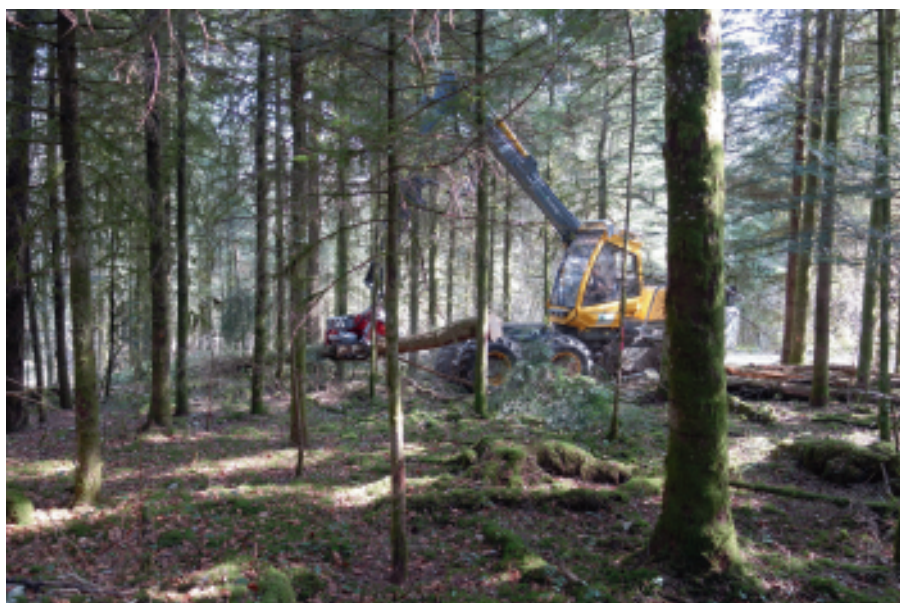
Printemps 2019 : abatteuse récoltant du bois énergie dans une coupe d'amélioration